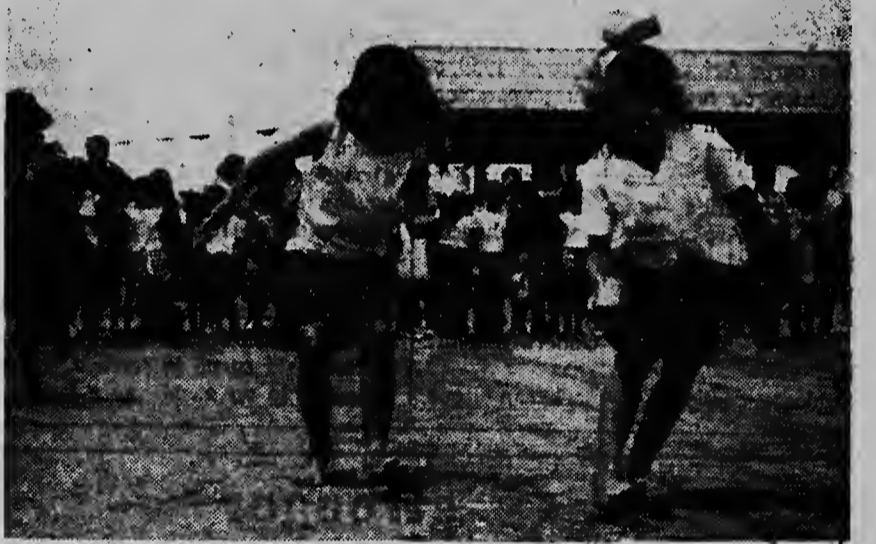
Hopi bisha e gustamentonan tabata masha interesante...